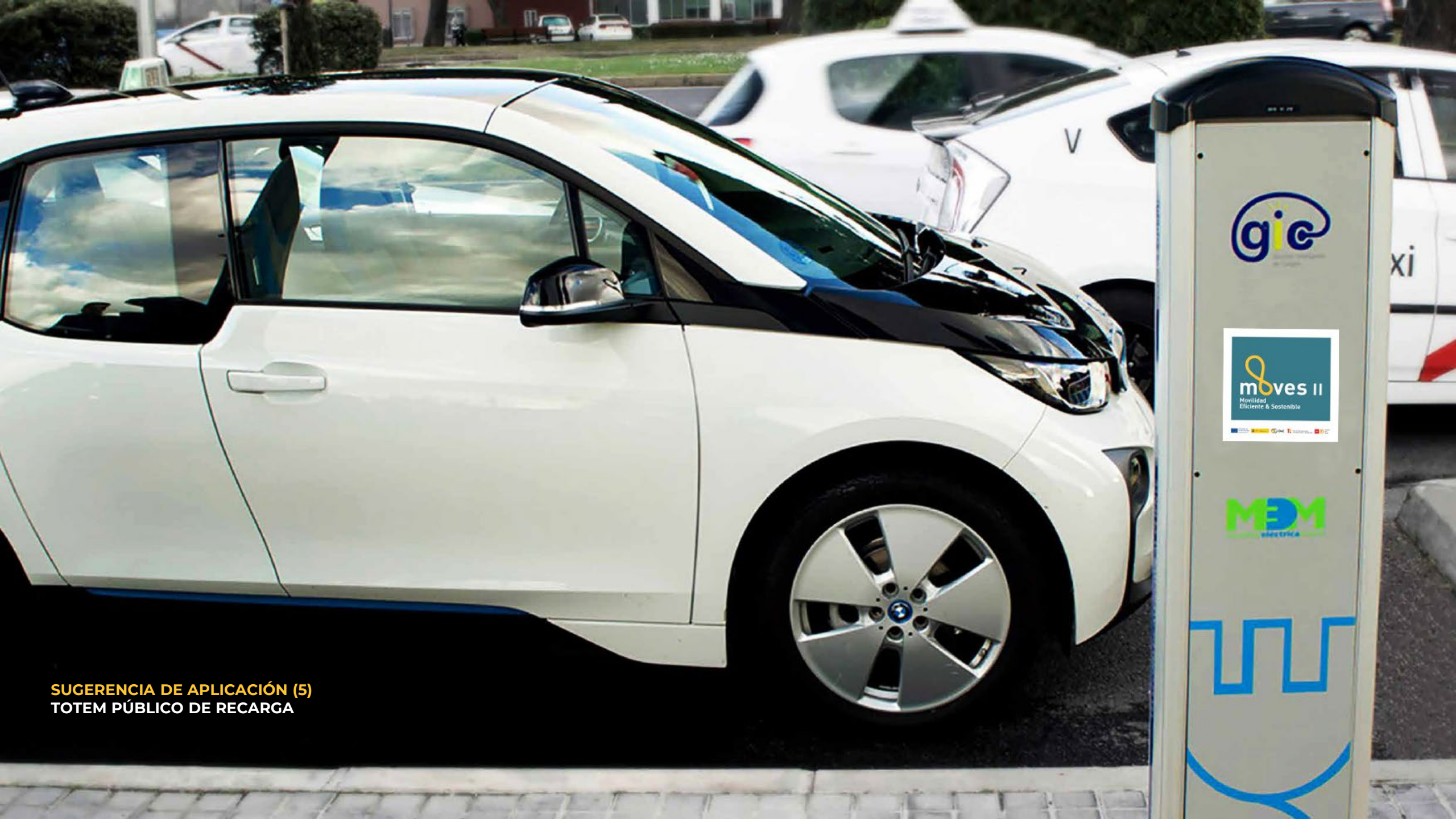
SUGERENCIA DE APLICACIÓN (5) TOTEM PÚBLICO DE RECARGA